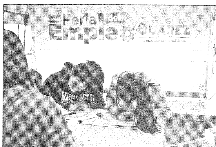
cisco y Valle Real. Empresas como Yazaki, Brg Sport, Oxxo, Seven Eleven, Farmacias Benavides, Modular Vanity, Industrias Vermont, Human Quality, Pepsico, entre otras, fueron algunas de las que pusieron a disposición de la ciudadanía sus vacantes.

Los juarenses acudieron a esta cita en la feria donde había plazas para operarios, técnicos, soldadores, vendedores, supervisores, electricistas, mecánicos diésel, personal administrativo y profesionistas